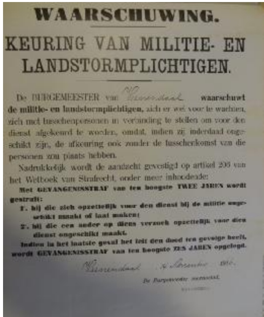
Keuring Nederlandse militairen