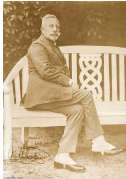
Keizer Wilhelm in Huis Doorn