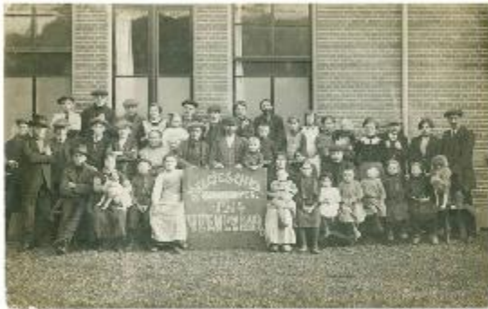
Belgische vluchtelingen in Veenendaal