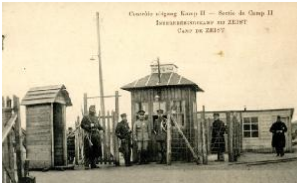
Controle van Belgische soldaten kamp Zeist