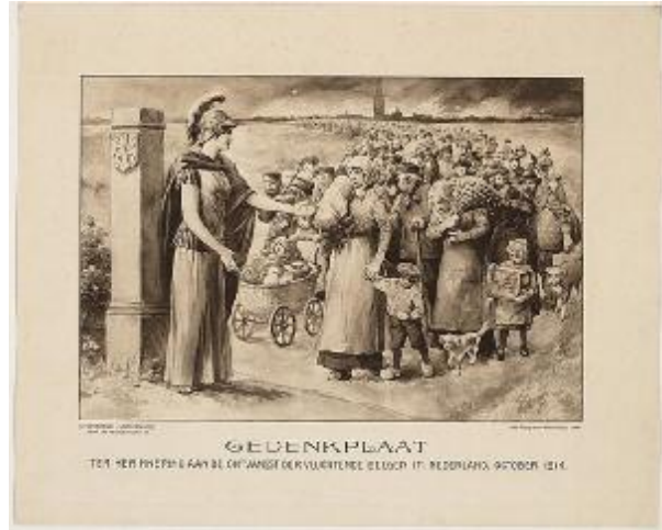
Een gedenkteken voor de Belgische vluchtelingen