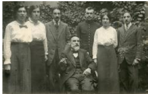
Belgische officieren in Amersfoort