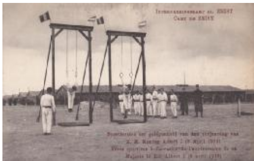
Sport in kamp Zeist