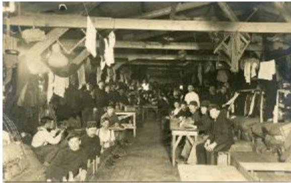
Geïnterneerde Belgische Soldaten in Zeist