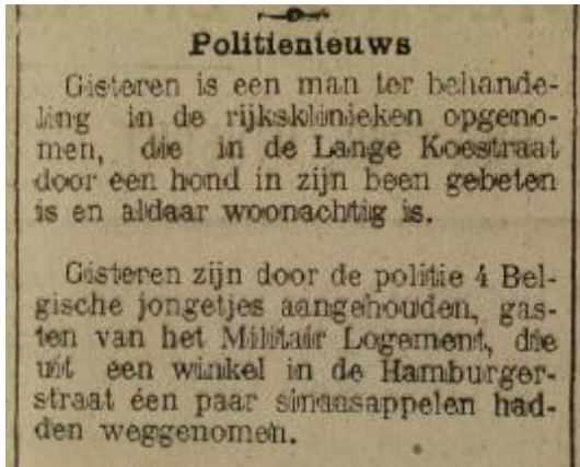
Onrust Belgische vluchtelingen