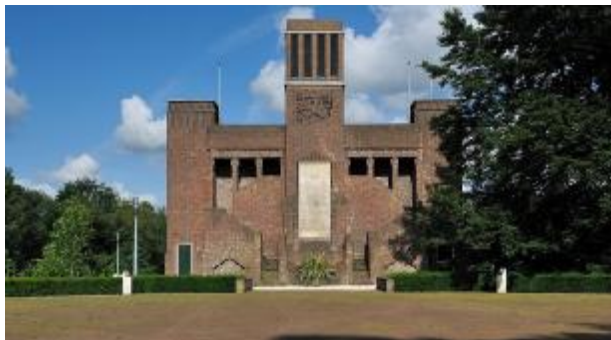
Het Belgen monument in Amersfoort