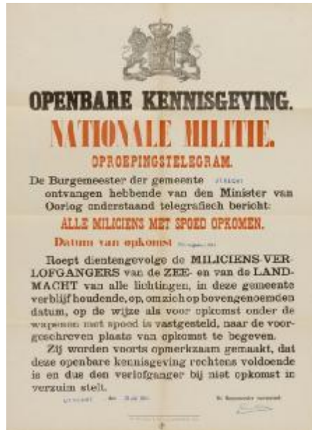
Oproep mobilisatie Nederlandse soldaten