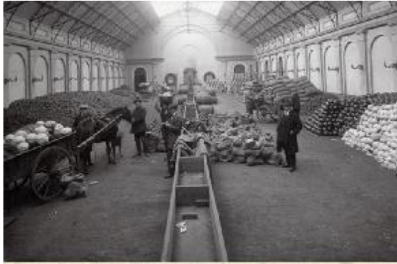
Regeringsgroenten te Utrecht. Een Achter in de voorgeschiede „Binnenland“ te Utrecht, welke thans te Degerland voor de uitdeling van regeringsgroenten in die provincie. Het Algemeen Administratie-kantoor voor Levensmiddelenvoorziening te Amsterdam zorgt voor de distributie aan de verschillende provincies van land, die dan weder zorgen voor de verdeling aan de Landsteden, welke de benodigde voorraden aan de opslagplaats moeten brengen halen.