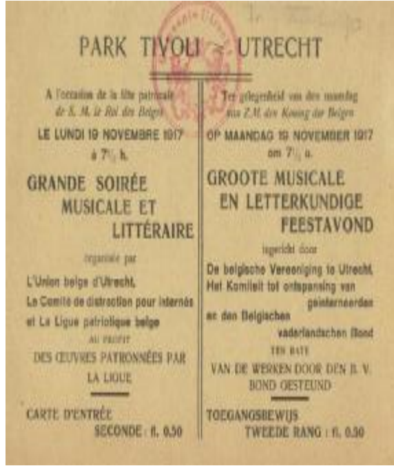
Activiteiten voor Belgische vluchtelingen