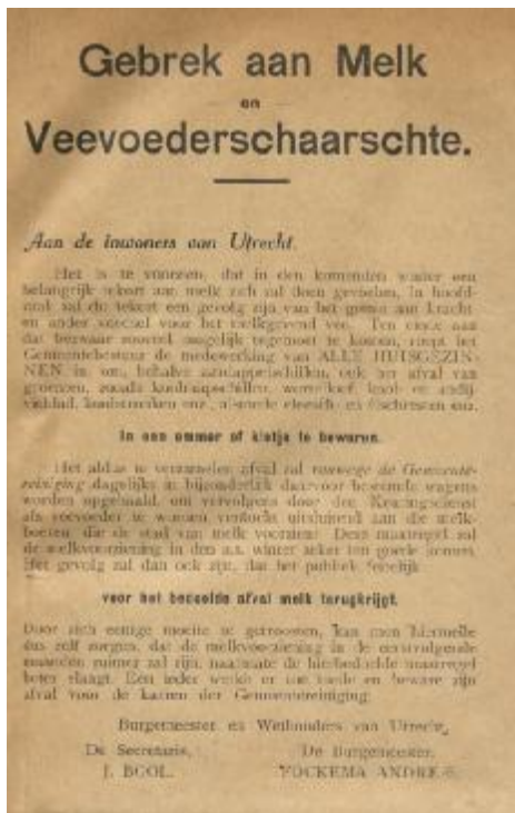
Schaarste in Utrecht