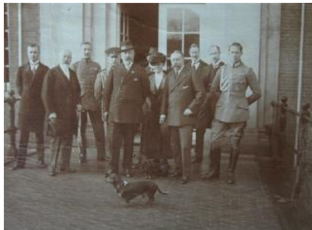
Wilhelm II komt aan in Amerongen